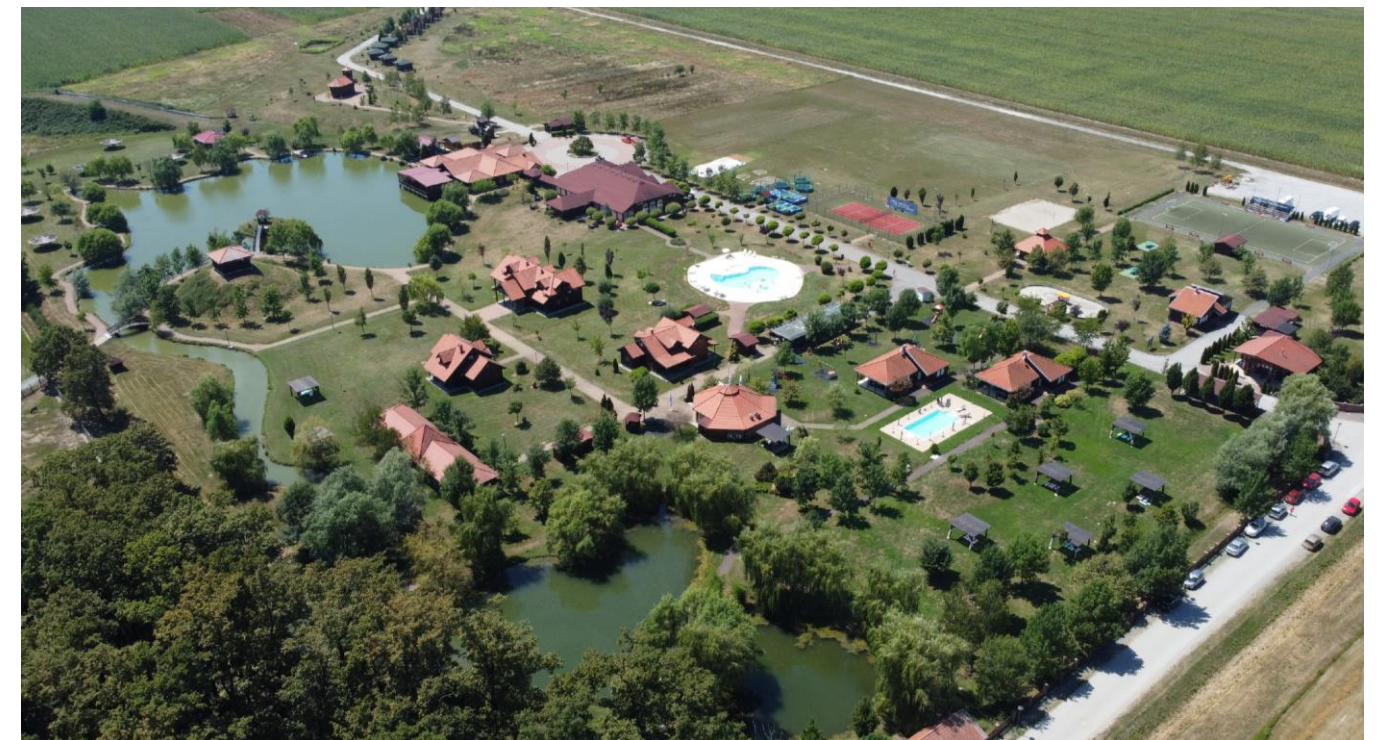
Zračni snimak trenutnog stanja realizacije područja važećeg UPU-a

Od donošenja UPU Kraš I i II - Eko Park Bratina do danas prošlo je četrnaest godina, tijekom kojih je područje obuhvata plana djelomično realizirano sukladno važećem UPU-u. Izgrađen je dio zone ugostiteljsko-turističke namjene ("Ekopark Krašograd"), dok su unutar sjevernog dijela gospodarske namjene smještene postojeće građevine u funkciji poljoprivrede.