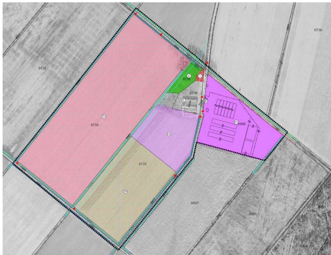
Izvadak iz kartografskog prikaza 1. korištenje i namjena površina, važećeg UPU Kraš I i II - Eko Park Bratina

Područje obuhvata UPU Kraš I i II - Eko Park Bratina, koji se stavlja izvan snage, odnosi se na cjelokupni obuhvat UPU Kraš I i II, čija površina iznosi 48,46 ha. To područje predstavlja izdvojeno građevinsko područje izvan naselja, namijenjeno mješovitim, ugostiteljsko-turističkim i gospodarskim sadržajima „Kraš“ I i II, predviđenima za kombinaciju turizma, sportsko-rekreacijskih sadržaja te sadržaja vezanih uz poljoprivrednu proizvodnju i preradu.