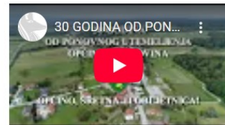
30 GODINA OD PONOVNOG UTEMELJENJA OPĆINE PISAROVINA

Kompletna dokumentacija dostupna na: https://pisarovina.hr/urbanisticki-planovi/