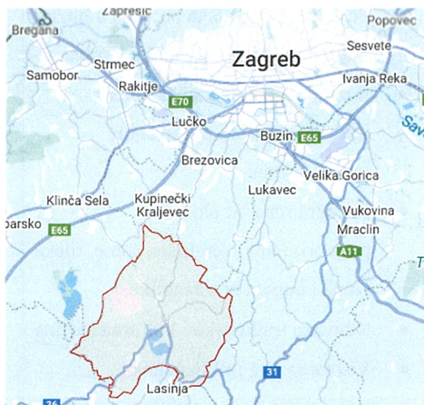
Slika 1 Geografski položaj Općine Pisarovina

Gospodarske su djelatnosti isprepletene i međuovisne, a putem podjele rada, razmjene, organizacije proizvodnje i upravljanja čine temelj društvenog života. Na stanje i razvoj gospodarstva utječu raspoloživost prirodnih i proizvedenih sredstava, ljudsko znanje i sposobnosti njegove uporabe kao i organizacijski oblici i društvene institucije koje reguliraju i usmjeruju gospodarske napore te raspodjela njihovih rezultata.