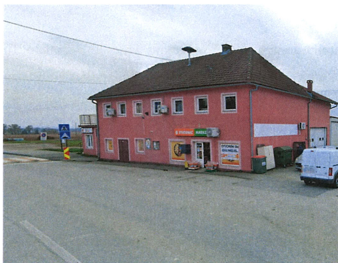
Slika 3. Vatrogasni dom u Bratini

Osim društvenih domova, na području Općine nalazi se 6 vatrogasnih domova koji prvenstveno služe obavljanju djelatnosti dobrovoljnih vatrogasnih društava u datim naseljima te za potrebe mještana. Isti se nalaze u naseljima Pisarovina, Bratina, Donja Kupčina, Lijevo Sredičko, Selsko Brdo te Gradec Pokupski. Tijekom