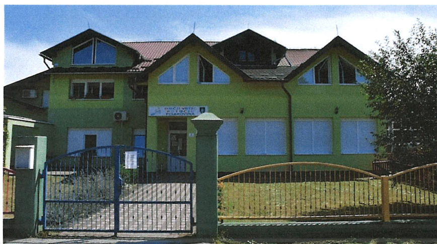
Slika 4. Dječji vrtić "Potočić" Pisarovina

U Općini Pisarovina institucionalno je organiziran predškolski odgoj, a u središtu općine djeluje Dječji vrtić „Potočić Pisarovina“, osnovan 2010. godine od strane Općine Pisarovina. Vrtić kontinuirano proširuje svoje prostorne i programske kapacitete kako bi odgovorio na povećane potrebe stanovništva.