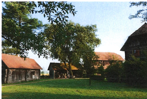
Slika 2. Zavičajni muzej Donja Kupčina